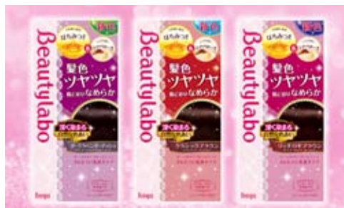
ビューティラボヘアカラー 医薬部外品