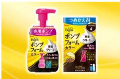
ビゲン ポンプフォームカラー 医薬部外品