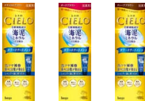
シエロ カラートリートメント 化粧品