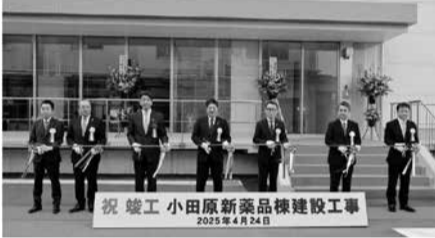
小田原工場内環境配慮型の医薬品新工場を竣工

花王など9社 花王は、キリンHD、JEPPLAN、TDK、村田製作所、ファンケル、キリンビバレッジ、ペトリファイナテクノロジー、アサヒ飲料の8社と業界を超えて連携し、飲料用ボトルと非食品用途PETを原料とするケミカルリサイクルにより、各種ペットボトルヘリサイクルする取り組みを開始する。なお、非食品用途PETを原料に、飲料用ペットボトルとして再生する取り組みは国内初となる。 今回の取り組みは、非食品用途PETへ拡大すること。工業用フィルム、工業用フィルム・化粧品用フィルム、自動販売機用商品サンプル、工業用フィルム・化粧品用フィルム、自動販売機用商品サンプルをケミカルリサイクルの原料として使用する。工業用フィルムには、TDKと村田製作所が、電子部品を製造する際に使用した工業用PETフィルムの端材をリサイクル材料として供給する。ファンケルは、PETボトルの再生されたPET樹脂の品質評価を実施し、再生PET樹脂を使用した使用済み化粧品の供給を行う。また、アサヒ飲料は10月以降の採用を予定しており、ファンケルにおいても採用に向けた検討を行っている。